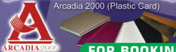
Arcadia 2000 (Plastic Card)