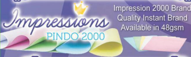
Impression 2000 Brand Quality Instant Brand Available in 48gsm