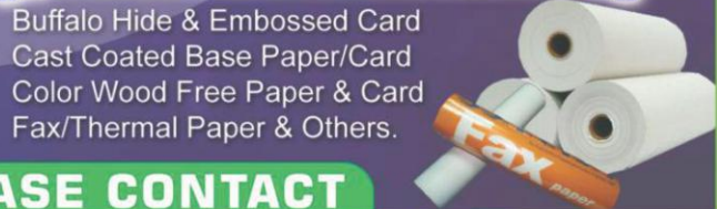
Buffalo Hide & Embossed Card Cast Coated Base Paper/Card Color Wood Free Paper & Card Fax/Thermal Paper & Others.