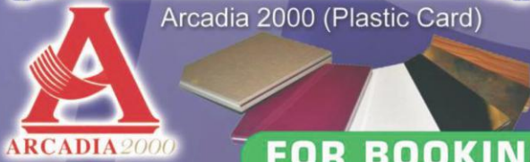
Arcadia 2000 (Plastic Card)