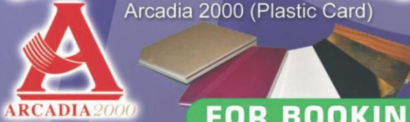
Arcadia 2000 (Plastic Card)