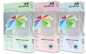
spectra color premium color paper