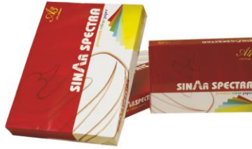
SINAR SPECTRA premium colour paper