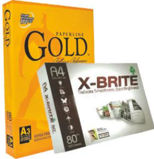
IK GOLD, X-BRITE IK COPY PAPER