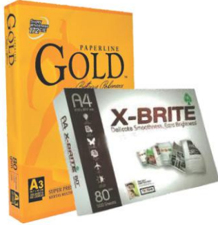
IK GOLD, X-BRITE IK COPY PAPER