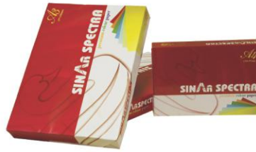
SINAR SPECTRA premium colour paper