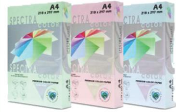
spectra color premium color paper