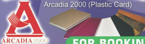
Arcadia 2000 (Plastic Card)