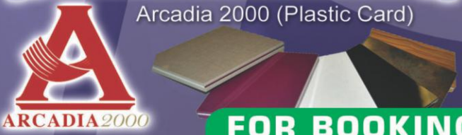
Arcadia 2000 (Plastic Card)