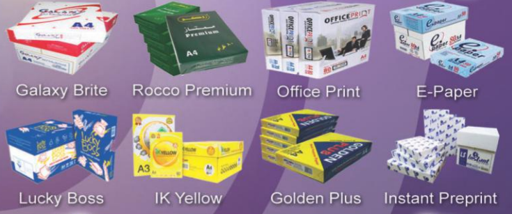
Galaxy Brite Rocco Premium Office Print E-Paper Lucky Boss IK Yellow Golden Plus Instant Preprint