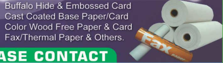
Buffalo Hide & Embossed Card Cast Coated Base Paper/Card Color Wood Free Paper & Card Fax/Thermal Paper & Others.