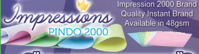
Impression 2000 Brand Quality Instant Brand Available in 48gsm