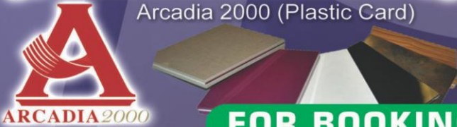
Arcadia 2000 (Plastic Card)