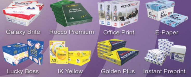
Galaxy Brite Rocco Premium Office Print E-Paper Lucky Boss IK Yellow Golden Plus Instant Preprint