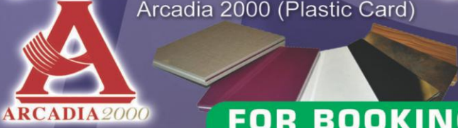
Arcadia 2000 (Plastic Card)