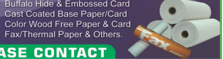
Buffalo Hide & Embossed Card Cast Coated Base Paper/Card Color Wood Free Paper & Card Fax/Thermal Paper & Others.