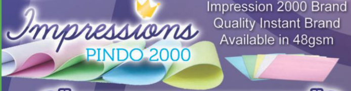
Impression 2000 Brand Quality Instant Brand Available in 48gsm