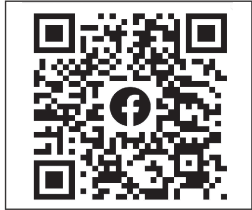
کیو آر کوڈ برائے چیمرز برنس فیس بک پیج

فونک سروے کے لیے لاگو ہوتا تھا۔ زمینی سروے نے تینوں شہروں میں منتخب صنعتی اور تجارتی علاقوں میں بے ترتیب واک کے طریقہ کار پر عمل کیا جس میں متعلقہ چیمرز کی رکنیت پر کوالیفائرسوالا تھے۔