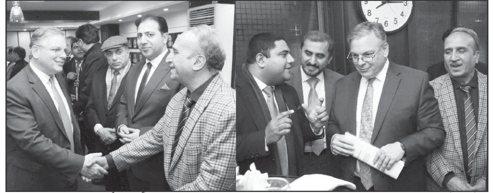
برنس مین گروپ پیپر مارکیٹ لاہور کے سینئر ممبر اور لاہور چیمبرز آف کامرس اینڈ انڈسٹری کی مینجنگ کمیٹی کے رکن خاص سعید بٹ پاکستان میں امریکی سفیر ڈونلڈ بلوم اور قونصل جنرل لاہور ولیم میکائیول کے دورے لاہور چیمبر کے موقع پر ملاقات کرتے ہوئے

لاہور (نیوز ڈیسک) ملک بھر کے چیمبرز آف کامرس اینڈ انڈسٹری نے سیاسی جماعتوں کی جانب سے جلد ہی میثاق معیشت پر دستخط نہ کرنے کی صورت میں عام انتخابات کا بائیکاٹ کرنے پر اتفاق کیا ہے۔ اس بات پر اتفاق رائے راولپنڈی چیمبرز آف کامرس