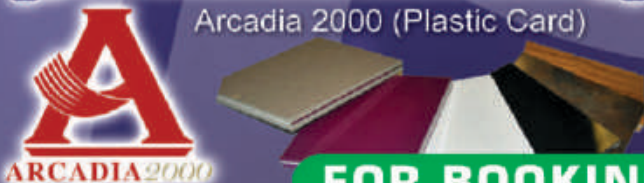
Arcadia 2000 (Plastic Card)