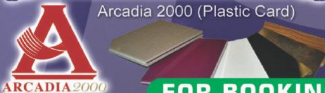
Arcadia 2000 (Plastic Card)