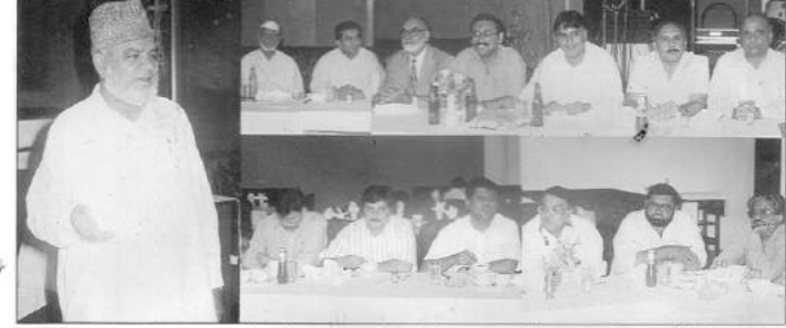
میان انعام اہل نیل خرم خرمیہ کے اجلاس میں جے ٹی کے نمائندوں نے اپنے موقف پر اصرار کیا۔ عوامی نمائندوں نے اپنے موقف پر اصرار کیا۔ عوامی نمائندوں نے اپنے موقف پر اصرار کیا۔

کراچی (پہرے بزنس نیوز) کلکٹ آف سٹریٹجی (ایس ڈیٹ) کراچی نے پرنٹرز سمیت ان کانج انڈسٹری کو بھی جزل سٹریٹجی کی رجسٹریشن اور ادائیگی کے لئے نوٹس جاری کئے ہیں جو اس سے اقبال فکسڈ سٹریٹجیس اور کر رہے تھے ان نوٹسز سے پرنٹرز اور دوسرے چھوٹے پرنٹوں میں شدید بے چینی پیدا ہو گئی ہے۔ باخبر ذرائع کے مطابق اس کشمکش میں آنے والی کانج انڈسٹری کی تعداد ۱۲ ہزار کے لگ بھگ ہے۔ ایسی انڈسٹری کو خبردار کیا گیا ہے کہ انہوں نے ۲۰ اگست تک قانون کے مطابق رجسٹر داخل نہیں کئے ہیں اور وہ مقررہ تاریخ تک اس کا جواب داخل کریں بصورت دیگر ان کے خلاف سٹریٹجی ایکٹ کے تحت کارروائی کی جائے گی۔ قبل ازیں ان کانج انڈسٹری نے حکومت سے ایک خاموش معاہدے کے تحت ۲۰ فیصد اضافے کے ساتھ فکسڈ سٹریٹجیس جمع کرا کر اپنا تمام ددونوں کلکٹریٹ نے اسے قبول نہیں کیا اور اسے کہا ہے کہ چونکہ فکسڈ سٹریٹجی کا قانون ختم ہو گیا ہے لہذا وہ جزل سٹریٹجی کی رجسٹریشن کرائیں اور جی ایس ٹی کی ادائیگی کریں اور مقررہ فرم رجسٹر باقاعدگی سے جمع کرائیں۔ دریں اثناء باخبر ذرائع سے معلوم ہوا ہے کہ سٹریٹجی کلکٹریٹ ایس ڈیٹ اور ڈیٹ نے تاجر تنظیموں کے دباؤ اور ایس ایم منیر اور فاسٹ کی مداخلت پر اس خاموش معاہدے کے حوالے سے جزل سٹریٹجی کی رجسٹریشن اور ادائیگی کے لئے کانج انڈسٹری اور درمیانے درجے کی صنعتوں کو جاری کئے گئے نوٹس واپس لے لئے ہیں جبکہ بعض صنعتوں کو جاری کئے جانے والے شکاژ نوٹس بھی واپس لے لئے گئے ہیں۔ اس سلسلے میں ذرائع کے مطابق فکسڈ سٹریٹجی ایس ڈیٹ اور ڈیٹ نے اپنے ماتحت عملے کو یہ ہدایات جاری کر دی ہیں۔