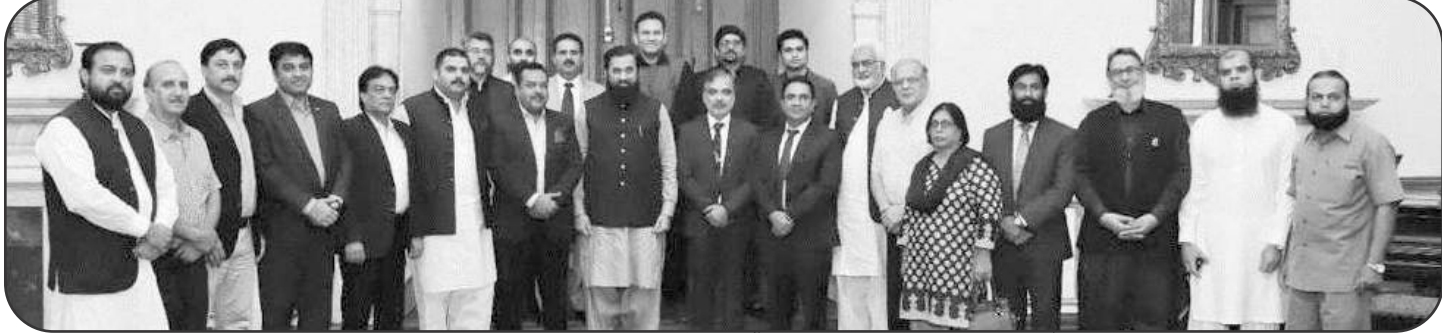
لاہور کے تاجروں کے ایک وفد نے گورنر پنجاب بلال خان مہر سے گزشتہ ہفتے ملاقات کی، اس موقع پر لیے گئے گروپ فوٹو میں لاہور پیپر مارکیٹ کے رہنما اور سابق صدر ڈیٹا سہیل ملک بھی شامل ہیں

اسلام آباد (بزنس ڈیسک) حکومت نے ریٹیل اور دکان داروں سے بجلی کے بلوں کے ذریعے نافذ کیا جانے والا فکس ٹیکس لینے کا فیصلہ تین ماہ کیلئے موخر کر دیا ہے۔ اس کا مطلب یہ ہوا کہ حکومت 30 ارب روپے مالیت کا ٹیکس جمع کرنے کے اقدامات سے دستبردار ہوگئی ہے اور اب حکومت کو یہی رقم جمع کرنے کیلئے دیگر ذرائع تلاش کرنا ہوں گے تاکہ آئی ایم ایف کے ساتھ کیے گئے وعدے کے مطابق بجٹ خسارہ پورا کرنے اور توازن کا بنیادی ہدف پورا کیا جاسکے۔ وفاقی وزیر برائے خزانہ مفتاح اسماعیل اور وزیر توانائی خرم دستگیر نے جمعرات 4 اگست 2022 کو تاجر رہنماؤں کے ساتھ مذاکرات کے بعد اس اقدام کا اعلان کیا۔ مفتاح اسماعیل نے کہا کہ وزیر اعظم شہباز شریف کی ہدایت کے تحت حکومت نے ایک سال کیلئے ریٹیلرز سے فکس ٹیکس لینے کا فیصلہ موخر کر دیا ہے۔ تین ماہ بعد حکومت ایک مرتبہ پھر تاجروں کے ساتھ مذاکرات کرے گی تاکہ اس ضمن میں موزوں نظام تیار کیا جاسکے۔ انہوں نے کہا کہ فی الحال ایک ماہ قبل جو ٹیکس نظام چل رہا تھا اسی پر عمل ہوگا۔ انہوں نے