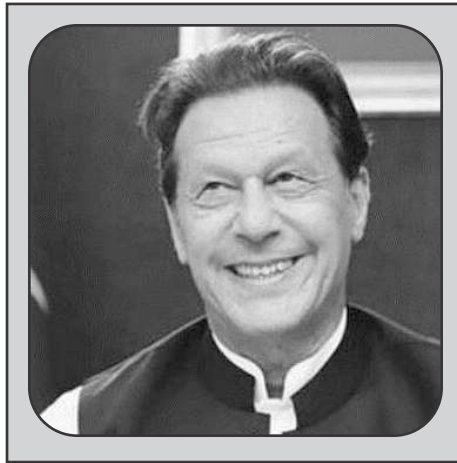
عمران خان سے ملاقات ہوئی ہے۔

کے قائدین سے بھی ملاقاتیں کرے گا اور سب کو ملکی معیشت کو بحران سے نکال کر ترقی کی راہ پر گامزن کرنے کیلئے میثاق معیشت کے معاہدے کیلئے رضامند کرنے کی کوشش کرے گا۔ چیئر آف کامرس کے سینئر رہنما سہیل الطاف کا عمران خان سے ملاقات کے بعد کہنا تھا کہ پاکستان تحریک انصاف کے سربراہ اور سابق وزیر اعظم سے راولپنڈی چیئر آف کامرس اینڈ انڈسٹری کے وفد کی ملاقات بہت مفید رہی ہے اور انکا میثاق معیشت پر دستخط کی رضامندی ظاہر کرنا تاجر برادری کیلئے انتہائی خوش آئند ہے۔ انہوں نے بتایا کہ عمران خان نے راولپنڈی چیئر آف کامرس اینڈ انڈسٹری کی جانب سے تیار کردہ میثاق معیشت پر دستخط کرنے پر رضامندی ظاہر کر دی ہے، اس کے علاوہ سابق وزیر اعظم نے پنجاب حکومت کی جانب سے انڈسٹریل زونز کیس اور رنگ روڈ منصوبے بارے پیشرفت پر بھی اتفاق کیا ہے۔