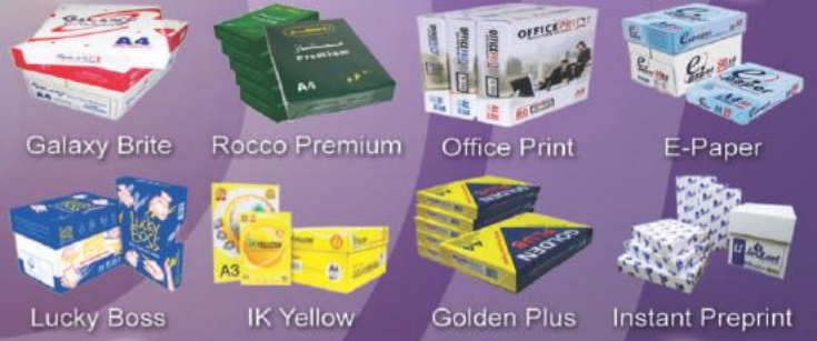
Galaxy Brite Rocco Premium Office Print E-Paper Lucky Boss IK Yellow Golden Plus Instant Preprint