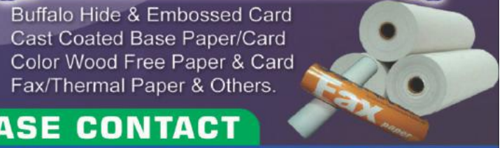
Buffalo Hide & Embossed Card Cast Coated Base Paper/Card Color Wood Free Paper & Card Fax/Thermal Paper & Others.