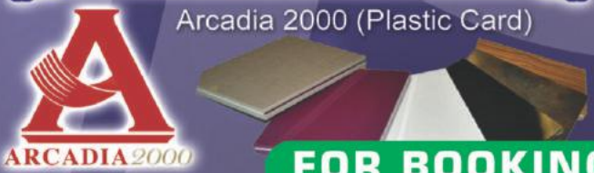
Arcadia 2000 (Plastic Card)