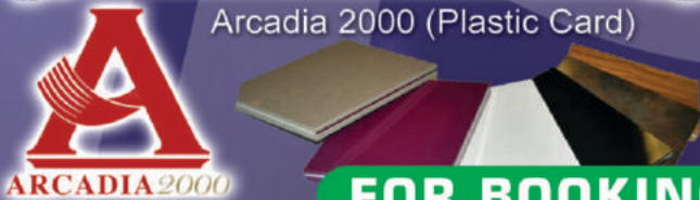
Arcadia 2000 (Plastic Card)