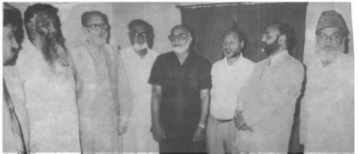
گلکرسٹم ڈرائی پورٹ سرفراز احمد خان کے اعزاز ایہما کے صدر ارشد ریاض کھیلو اور عامل ذرائع احمد ملک، امیر الوداعہ ذرائع سرفراز احمد خان، ارشد ریاض کھیلو اور عامل ذرائع

لاہور (پیپر پرنس نیوز) وفاقی حکومت نے انکم ٹیکس کمشنروں کو گوشوارے جمع نہ کرانے والے قابل ٹیکس افراد کے خلاف فوجداری مقدمات درج کرانے کے اختیارات دے دیئے ہیں ان کے اثاثوں کی تظہیروں انکم ٹیکس نے اشر خود کریں گے۔ ابتدائی طور پر بڑے عائد کے بائیں گے اس کے بعد مقدمات قائم کرنے کی عمارش کی جائے گی۔