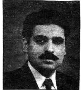
تحریر..... کامران خان ترجمہ..... ایم رؤف

ننان پیپر اینڈ بورڈ ملز کے قیام اور منڈیالی پیپر اینڈ بورڈ ملز میں توسیع کے بعد جن کی پیداواری صلاحیت بالترتیب 45 ہزار اور 15 ہزار ٹن ہے پمپل کے آخری مراحل میں ہیں اور توقع ہے کہ جلد ہی یہ پیداوار شروع کردیں گے اس طرح آئندہ سال 96-1995ء میں ملک کی ڈپلیکس بورڈ کی تمام طلب پوری کر لی جائے گی اور ملک اس کی پیداوار میں خود کفیل ہو جائے گا۔ لہذا یہ تجویز پیش کی جاتی ہے کہ دیگر ممالک کی طرح ویسٹ پیپر کی ڈیوٹی فری درآمد کی اجازت دی جائے تاکہ ہماری ملیں اپنی مکمل پیداواری صلاحیت کو استعمال کر سکیں اور درآمدات کا فائدہ اٹھالیں۔