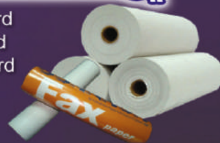
Buffalo Hide & Embossed Card Cast Coated Base Paper/Card Color Wood Free Paper & Card Fax/Thermal Paper & Others.