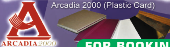
Arcadia 2000 (Plastic Card)