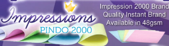
Impression 2000 Brand Quality Instant Brand Available in 48gsm