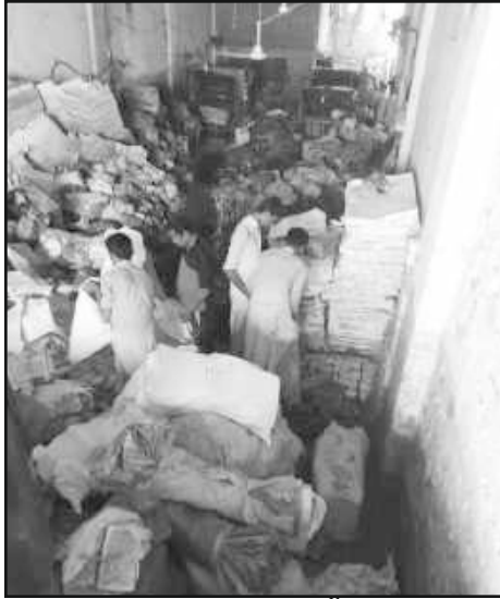
حالیہ بارشوں سے اورنگی ٹاؤن میں قائم عالم ہائڈرو کی دکان کا تباہ حال منظر، لاکھوں کی تعداد میں طبع شدہ میٹریل ضائع ہو گیا

ہیں اور اے ای او اس سلسلے میں اہم قدم ہے۔ اس پروگرام کو قانونی شکل دینے کے لئے کسٹمز ایکٹ 1969 میں فنانس ایکٹ 2018 کے ذریعہ ترمیم کی گئی جبکہ ایس آر او 2020 (I) 798 بتاریخ 28 اگست 2020 کے ذریعہ اس قانون پر عملدرآمد کے لئے قوانین جاری کئے گئے۔ ایف بی آر کا کہنا ہے کہ اے ای او کے ذریعہ کسٹمز کلیئرنس میں پائے جانے والی کئی مشکلات ختم ہو جائیں گی۔ وہ ٹیکس پیئرز جن کا ریکارڈ کلیئر ہے، ان کے لئے اے ای او میں بہت آسانیاں پیدا ہو جائیں گی جس سے ان کا قیمتی وقت بھی بچے گا۔